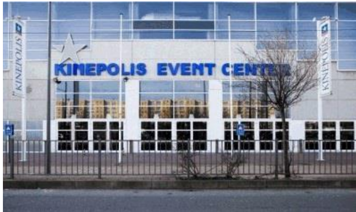
Kinopolis Event Center – Groenendaallaan 394 – 2030 Antwerpen

En wat voor één! Wij hebben een akkoord maken met het B2B Account Management van het Kinopolis-complex in het noorden van Antwerpen; we keren dus terug naar een beter bereikbare plaats mét parking nabij het centrum van de stad.